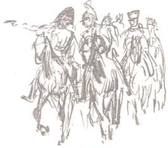
FDC 200. VÝROČÍ BITVY U SLAVKOVA