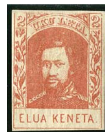
1861 – Mi.11

Všechny uvedené emise známek jsou pouze stříhané na různých druzích papíru bez průsvitky.