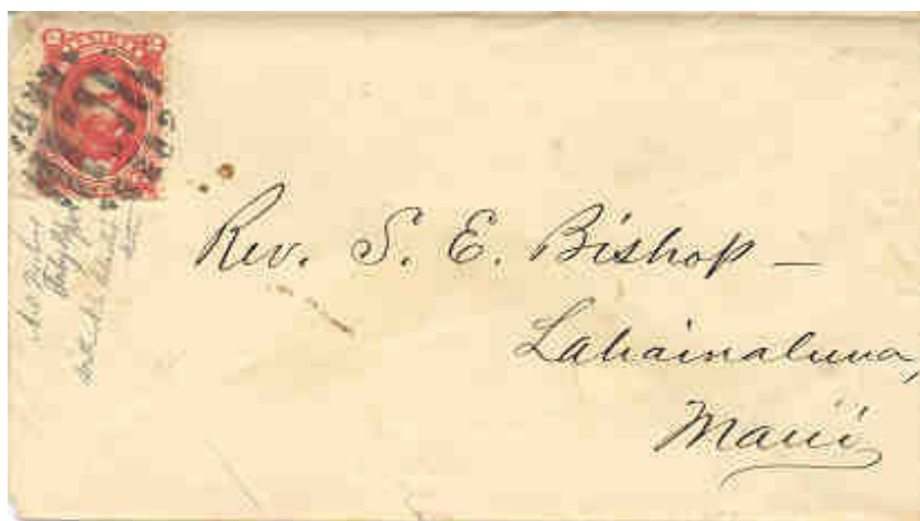
Obálka ze 16.2.1868

První zoubkovaná známka byla vydaná v roce 1864 v hodnotě 2centů – zoubkování 12. Toto zoubkování se užívalo až do r. 1899 do zániku samostatné emisní činnosti Havajských ostrovů.