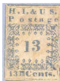
Mi.4 – II.typ

Zachovalo se 8 známek nepoužitých, 34 použitých a 9 na dopise.