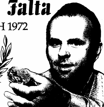
Král českých rychlopalníků