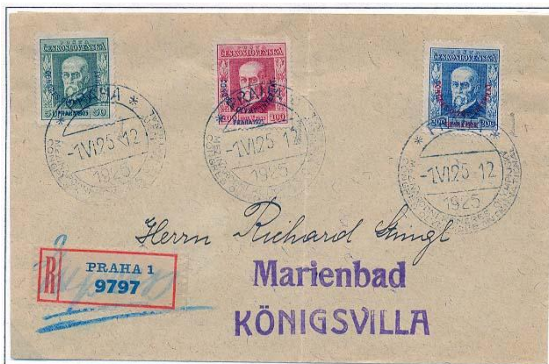
Doporučený dopis, odeslaný 1.6.1925 z Prahy do Mariánských Lázní, pře frankovaný o 0,50 Kč, razítkovaný PR II. typu.