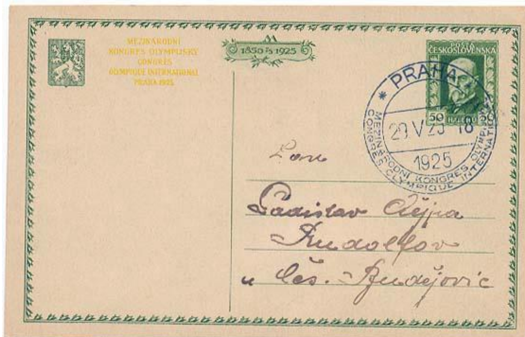
Kongresová dopisnice s přitiskem ve žluté barvě, odeslaná z Prahy do Rudolfova 29.5.1925. PR I. typu.

znehodnocování kongresových známek a dopisnic. Výskyt příležitostných razítek na zásilkách s nekongresovými známkami je minimální. Razítka II. a III. typu byla používána pouze do 4.června.