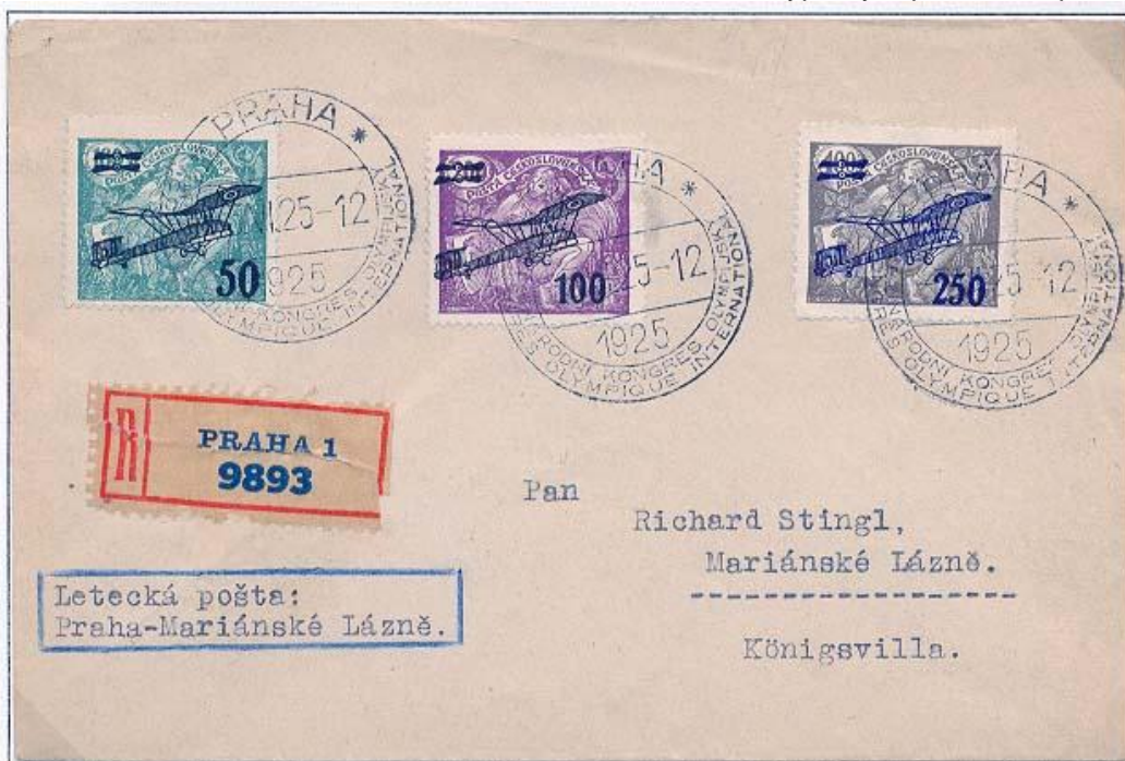
Letecký doporučený dopis Praha – Mariánské Lázně, zajímavý tím, že jako frankatura nejsou použity kongresové známky, ale známky II.letecké emise. PR I.typu, odesláno 3.6.1925 ve 12.00.

Posledním doloženým dnem použití razítka I.typu bylo 5.června v 16 hodin. Příležitostná razítka všech tří typů byla používána prakticky výhradně pro