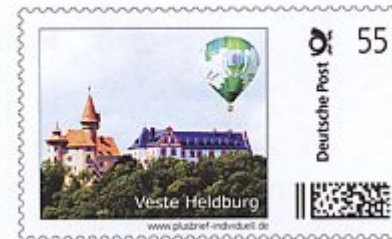
Ausschnittvergrößerung des Plusbriefes