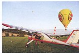
15. Thüringer Montgolfiade 22.-24. August 2008